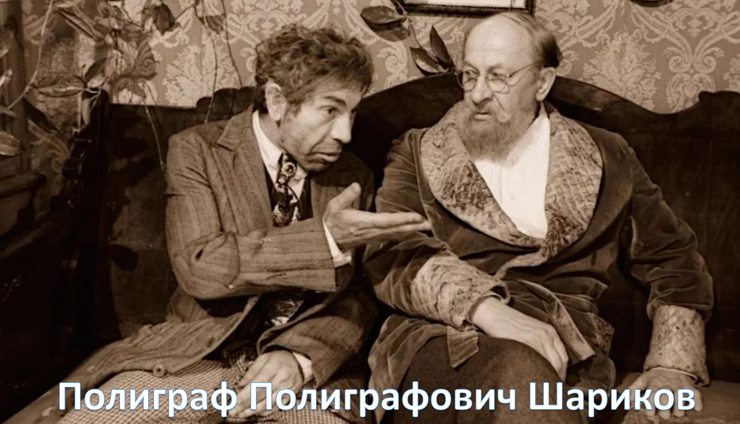
Полиграф Полиграфович Шариков